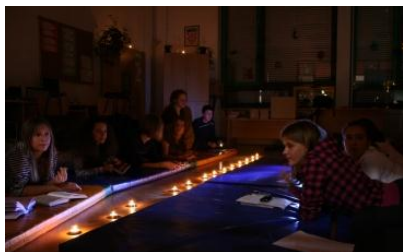
Naše prvo noćenje u knjižnici.