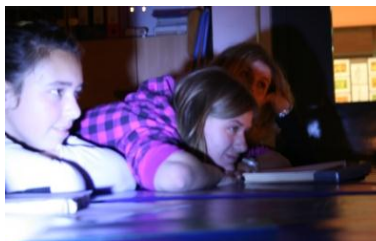
Uživamo slušajući se.

Preko web 2.0 profila naših knjižnica objavit će se snimke čitanja iz užitka (ne i drugih