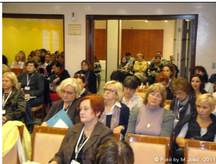
Sudionici stručnog skupa Horori a priori?! , Hotel Park, Split 28.-29.listopada 2011.

Sudionici skupa nisu bili samo školski knjižničari, jer je tema kojom se skup bavio privukla kako knjižničare dječjih odjela narodnih knjižnica tako i učitelje/nastavnike hrvatskoga jezika.