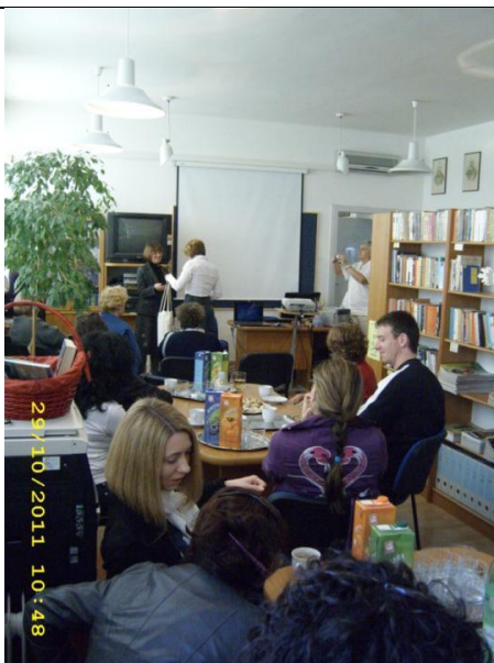
Stručni izlet, 29. listopada 2011.:

Mlade trebamo poticati da razmišljaju i na temelju vlastitog iskustva donose zaključke i stavove koje će spremno braniti, a da bismo ih u tom kontekstu osnažili za život trebamo ih, na što nas je podsjetila i profesorica Stričević, uključiti u izbor i nabavu građe: S njima, a ne (samo) za njih! (Walter, 2003.)